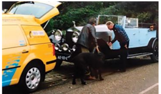
Harry Beaumont: "Mijn wegenwachttijd ligt tussen september 1965 en december 2004. Een verzoek voor hulp aan een Rolls Royce uit 1933 leverde deze foto op. Genomen in de zomer van 1992 in Schimmert."