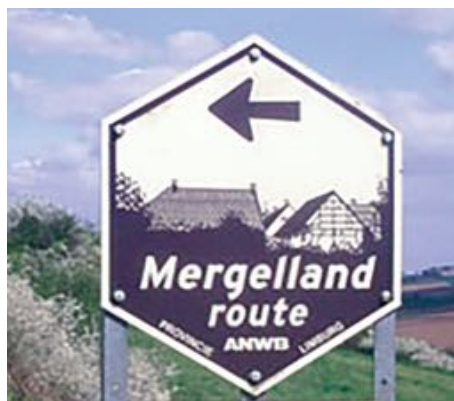
Tegenwoordig wordt de Mergellandroute aangegeven met bruin-witte, zeskantige borden. De oude blauw-witte routeborden vind je terug in brocantewinkels.

Want waar kun je ons binnenste buitenland beter ervaren dan in de heuvels van Zuid-Limburg. De bebording geeft een comfortabele en verkeersveilige manier van rijden. De sportieve fietser vindt zijn uitdaging in de soms pittige hellingen. Automobilisten en fietsers ieder hun eigen Mergellandroute. In het verleden maakten beide groepen gebruik van dezelfde routeborden en dus hetzelfde parcours, wat op drukke dagen veel risico's met zich meebracht. Automobilisten beschikken over bruin-witte routeborden en de fietser kan een traject volgen van 155 km via de