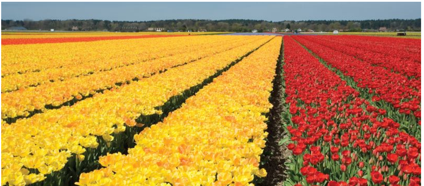
De bollen zijn inmiddels uitgebloeid, de akkers zijn leeg. Op de wensenlijst voor volgend jaar: de bollenstreekroute.