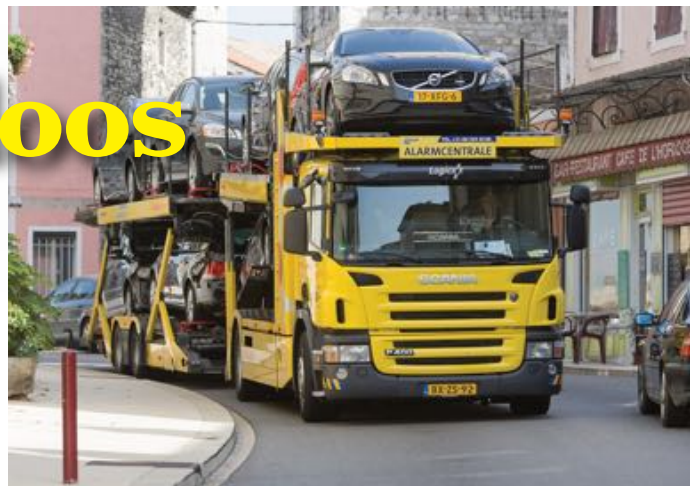
Zit uw auto hiertussen ...?

Heeft u ooit met pech onderweg gestaan en zijn daar foto's van? Misschien werkt u op een van de diepladers die de Alarmcentrale naar het buitenland stuurde om gestrande auto's terug te halen naar Nederland? Of heeft u als freelance-chauffeur een aparte reis gemaakt waarvan foto's bewaard zijn gebleven? Wellicht zitten er in uw foto-album – digitaal of anders - nog foto's van spannende tochten of zelfs van een van de gipsvluchten. Het mogen zeker oude foto's zijn, maar graag altijd met een verhaal. Belangrijke feiten kunt u in uw verhaal kwijt, zoals wanneer die foto is gemaakt. Wie staan er op die foto? Hoe komt u aan die foto en waarom heeft u hem bewaard? Kortom, herinneringen die we graag delen.