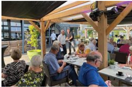
In Paterswolde praatten 39 mensen bij in Restaurant De Twee Provinciën