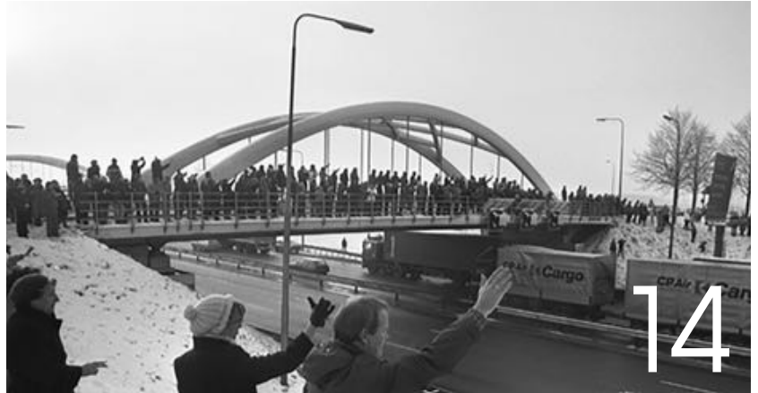
Actie Hart voor Polen