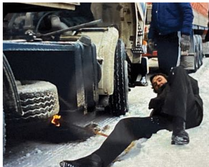
Een vuurtje stoken onder de tank om de diesel weer vloeibaar te maken