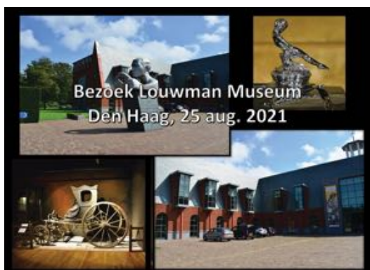
Bezoek Louwman Museum Den Haag, 25 aug. 2021

Het is natuurlijk niemand ontgaan dat in 2021 de Wegenwacht een feestje vierde: 75 jaar! Daar is al veel over geschreven in alle ANWB-media. Ook de Buitenband vierde deze mijlpaal in het kort mee.