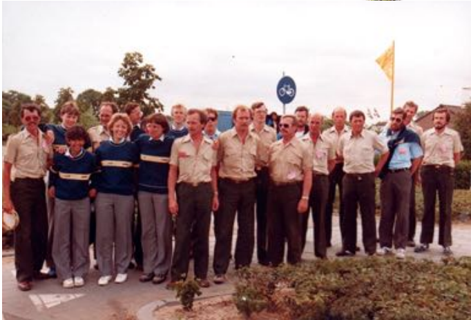
Deze ploeg loopt de vierdaagse in 1983. Niet alleen Wegenwacht, maar ook collega's van het hoofdkantoor.