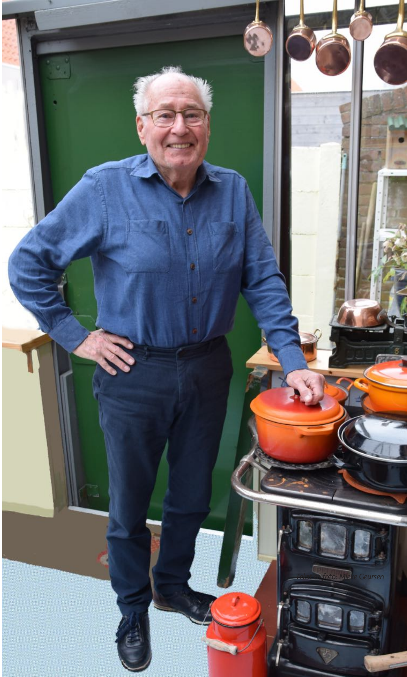
Tekst en foto: Mieke Geursen