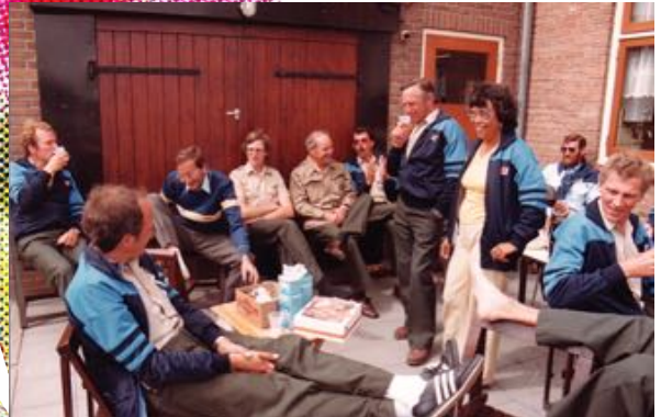
Rustpauze onderweg. We blazen even uit, terwijl de ANWB-crew ons prima verzorgt met eten en drinken.