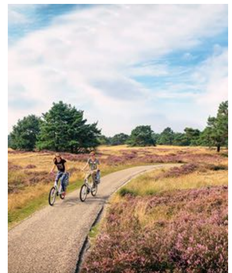
Tekst Frans de Kok