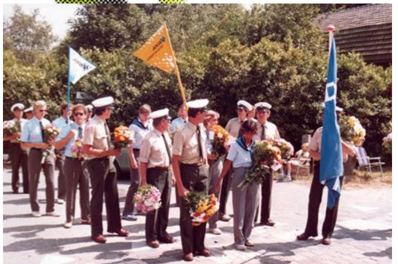
Klaar voor de officiële intocht. Met vlag en vaandel op weg naar de Via Gladiola.