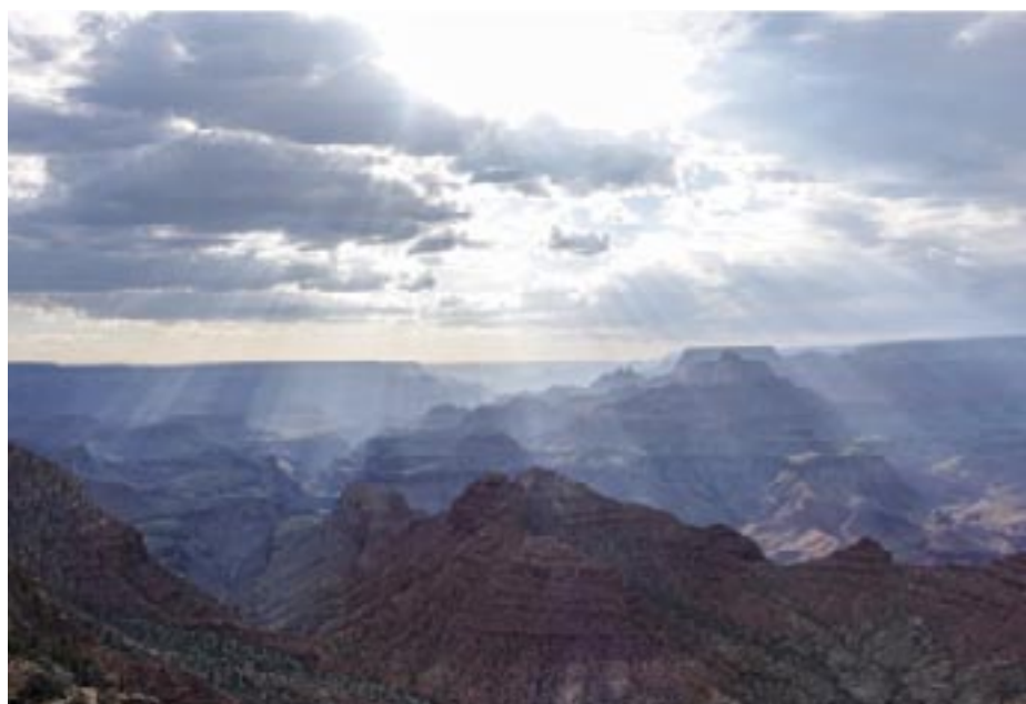
ZW Amerika. Winnaar Kleur Ko Droogers. Prijz Ingelijste foto op A3-formaat. Foto heeft iets extra's door de diepte en de zonnestrallen die door de wolken breken.

Heb je een goede foto die iets oproept stuur die dan op naar buitenband@vg-anwb.nl en sta jij straks ook in de Buitenband. ■