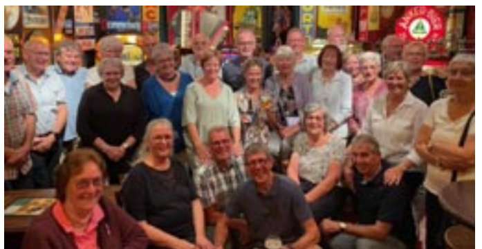
Regio bijeenkomst in Breda.