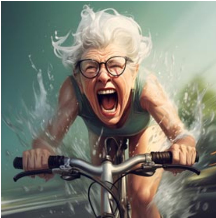
Foto is gegenereerd met AI, met de zoekopdracht 'de gelukkige oudere'.