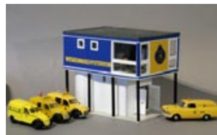
Rechts: Wegenwachtstation Pauwmolen in de schaal 1:43.