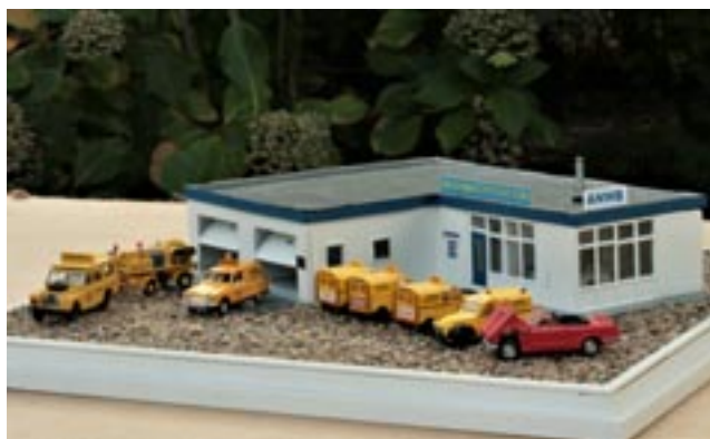
Wegenwachtstation links: Zeelandbrug in de schaal 1:87.

Heb je ook een hobby die je wilt delen met de VG-ANWB leden? Laat het ons weten en stuur een e-mail naar buitenband@vg-anwb.nl , in de onderwerpregel mijn hobby.