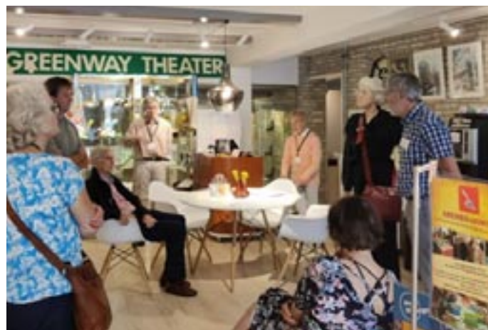
Museumbezoek in de regio Voorschoten.

zie je op de website foto's of een bericht over een oud-collega waarmee je contact wilt leggen.