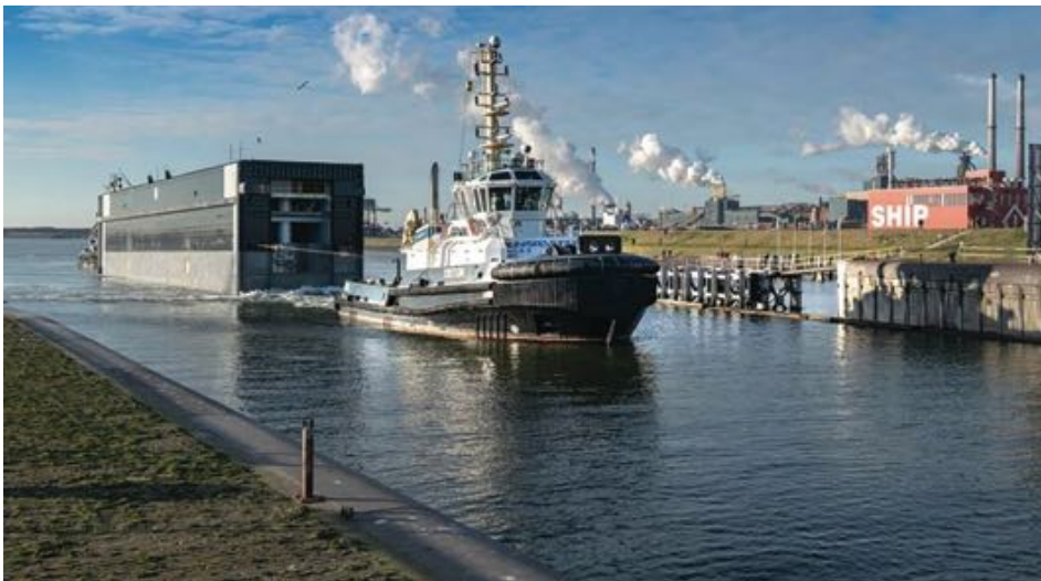
De eerste van in totaal drie sluisdeuren wordt door een sleepboot naar de sluislocatie vervoerd.

In de expo ligt het hele sluisencomplex op schaal aan je voeten. De schaal is zo aangepast, dat je door de sluisen kunt lopen. Als de rondgang klaar is, snap je – zelfs als nazaat van de twee linkerhanden-soort – dat in IJmuiden wat groots wordt verricht.